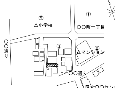
付近見取図 縮尺 (1/1500)

★町名、街区番号、近辺目印となる、公共施設や通り名を記載。 (個人名の記載はしないこと。) 届出箇所をハッチング等で明確にする。