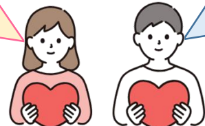
相談会参加者の声