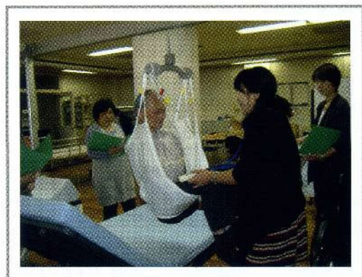
トランスファー相談

○ 在宅介護をされているご家族で介護の方法で困っている方に対して、センターに来所していただき介護方法の実習を交えた相談に応じています。