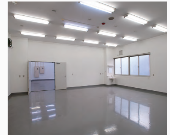
工場施設(第二工場ビル 102号室)