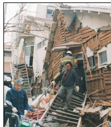
阪神・淡路大震災の救出の様子