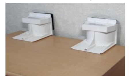
移動できない大型家具用

×取り付けできない壁材 セメントモルタル、石こうプaster(表面から砂や粉がはがれる)、表面のやわらかい壁紙(指で押すとふかふかしてはがれやすい)、コルク壁紙(コルクが表面にはってある)、紙壁紙(和紙や紙布でできた壁紙)、ふすま、障子など