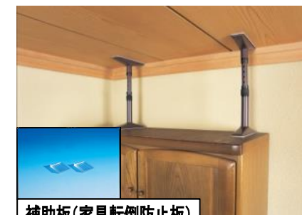
補助板(家具転倒防止板)