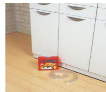
壁にぴったりつけてください。