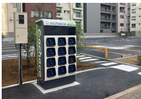
GS パーク板橋区役所前