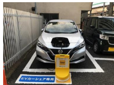
初代ステーション (板橋区二丁目 68-1)

令和2年度当時はEVがほとんど普及しておらず、区民が乗れる(触れる)機会もない状況でした。