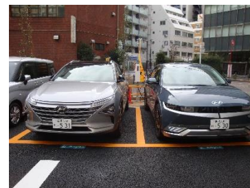
新ステーション (EV) (GSパーク板橋区役所前) (板橋区二丁目 61-6)