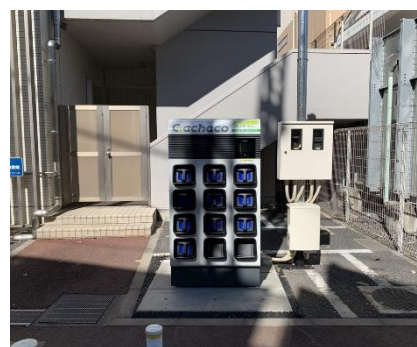
グリーンカレッジホール 駐輪場