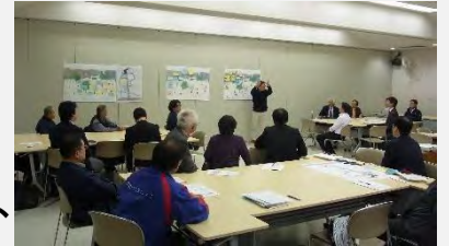
＜意見交換会の様子＞

今回のお知らせでは、当日板橋区から説明した都市計画決定の内容や皆様からご意見いただいた内容をご報告致します。