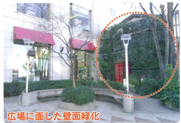
広場に面した壁面緑化