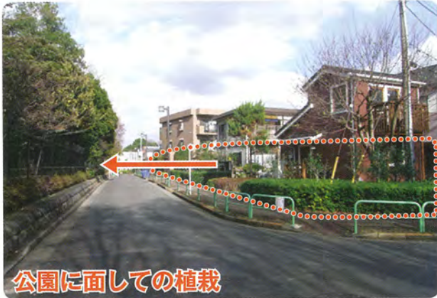
公園に面しての植栽

公園に面した道路際に、緑を連続させることで、うるおいのある街並みが形成されています。