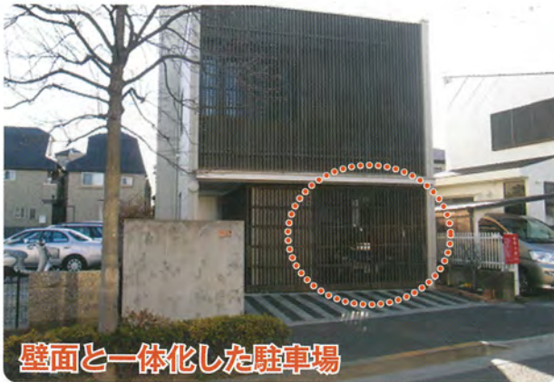
壁面と一体化した駐車場

駐車スペースを、外壁の意匠と同じ格子状の扉で隠すことで、整然として落ち着いた空間が形成されています。