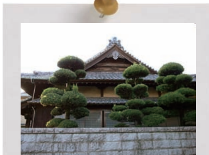
寺社に用いられた木材や石材などの自然素材