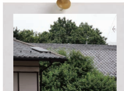
崖線の緑に溶け込む低彩度の屋根色