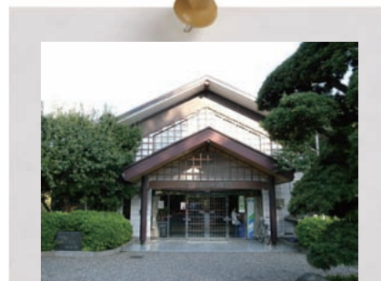
伝統的建材と類似する色彩の郷土芸能伝承館