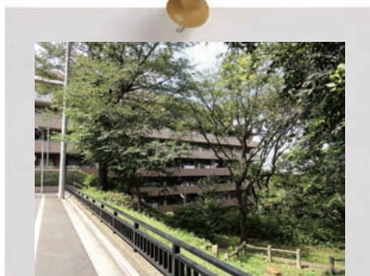
崖線の緑に融和する色彩のマンション