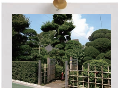
自然豊かな景観を創出する植栽