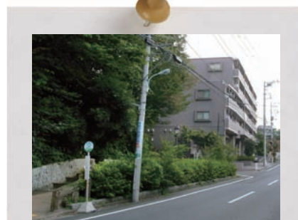
植栽や街路樹の緑が連続する不動の滝周辺