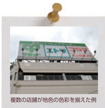
複数の店舗が地色の色彩を揃えた例

屋外広告物の基調となる色彩を揃えることで統一感が生まれ、建物や街並みとの調和に配慮することができます。