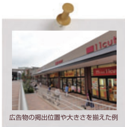
広告物の掲出位置や大きさを揃えた例

屋外広告物の掲出位置を計画的に揃えることで、建物全体のまとまりだけでなく、親切でわかりやすい情報提供にもつながります。