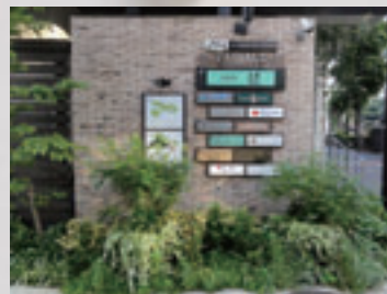
屋外広告物の足元を緑化した例