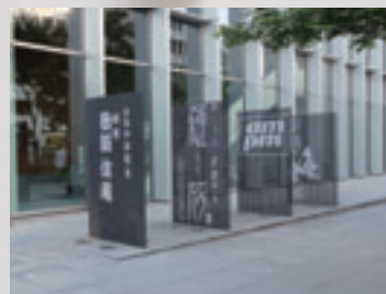
街の雰囲気に合わせた色彩で統一した例