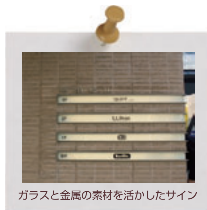
ガラスと金属の素材を活かしたサイン