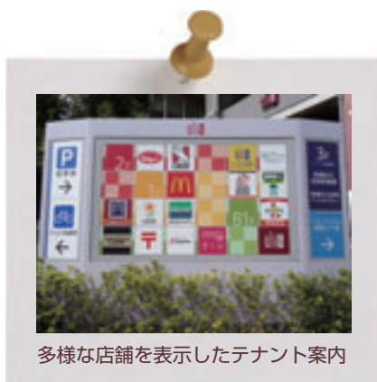
多様な店舗を表示したテナント案内

各テナントの多様な色彩やデザインも、大きさや形を揃えることで、すっきりとした表示となり、街並みに調和する心地よいものとなります。