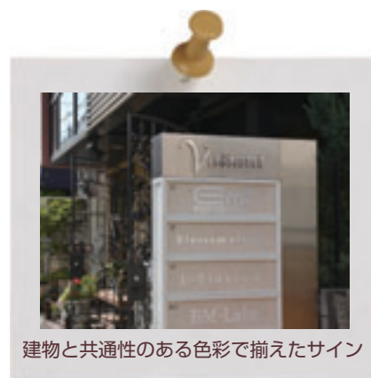
建物と共通性のある色彩で揃えたサイン