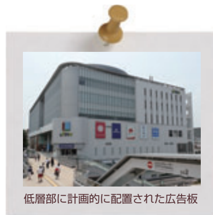
低層部に計画的に配置された広告板