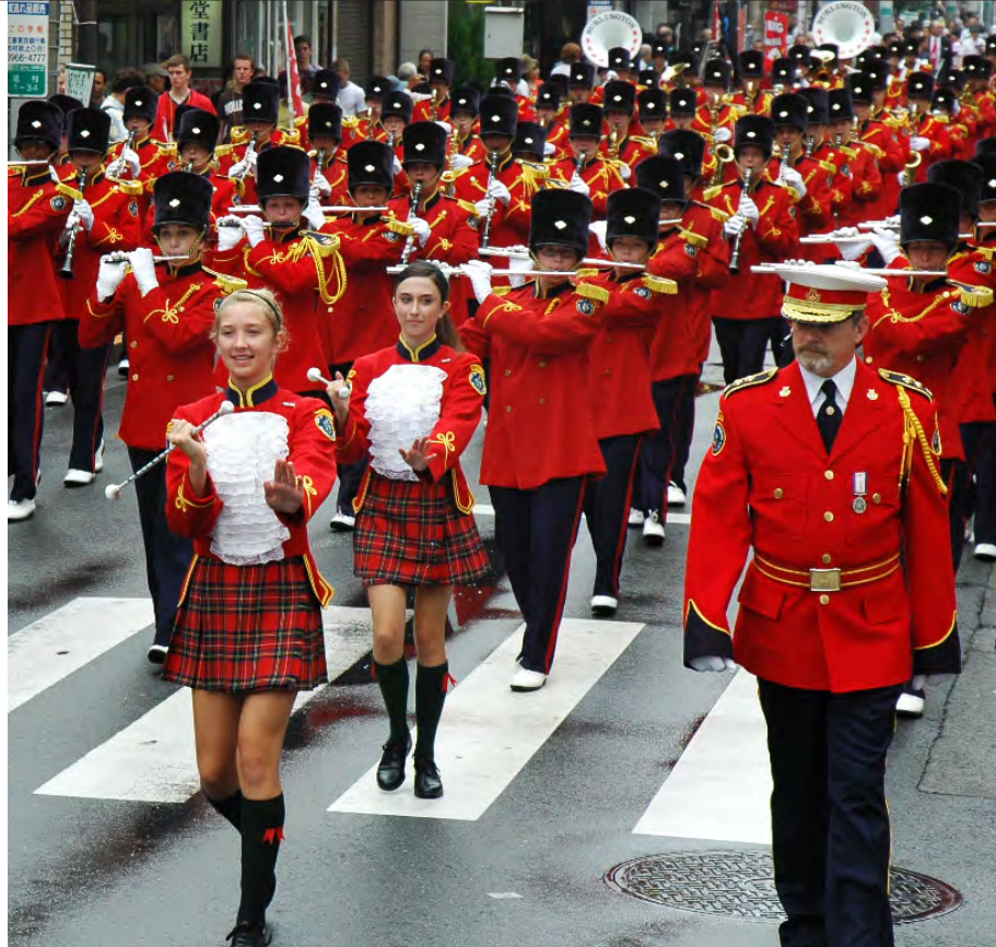
姉妹都市提携20周年記念として平成21年8月2日、カナダ最大級のマーチングバンドが志村銀座商店街で迫力のパレードを披露