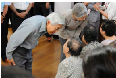
平成23年／被災者を見舞われる天皇・皇后両陛下