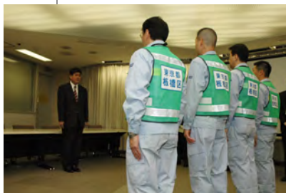
平成23年／岩手県大船渡市へ職員派遣