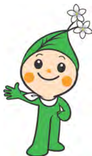
平成20年／観光キャラクター「りんりんちゃん」