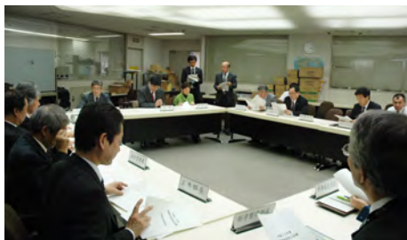
平成23年／東日本大震災により災害対策本部を設置