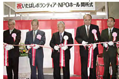
平成14年／ボランティア・NPOホールを開設