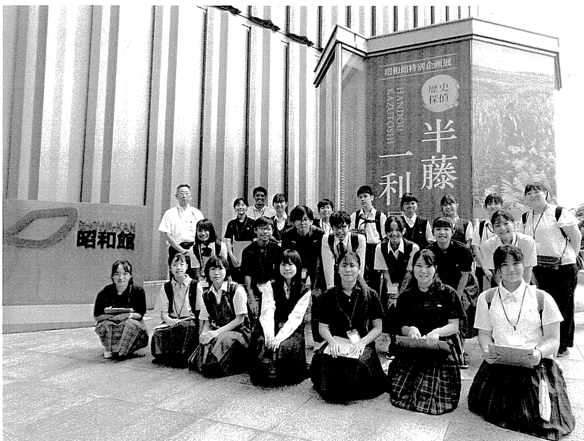
昭和館にて (東京都千代田区)