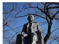
旧養育院長渋沢栄一銅像

※展覧会開催を記念したイベント 開催予定です。詳細は公式HP にて告知いたします。