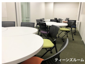
ティーンズルーム