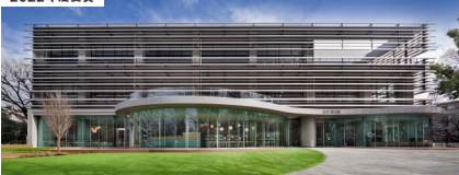
（板橋区立中央図書館）