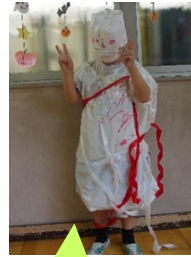
季節のイベントとしてハロウィンの仮装衣装づくりを行いました！

キックや体の接触がなく、子どもでも安全に遊べる「タグラグビー」を経験者である職員の指導のもと、児童と職員交えてみんなで行いました！