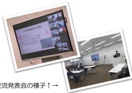
生徒会交流発表会の様子↑

発表会を通じ、生徒会から「他校の生徒会活動の多くの取組を知ることができた」「他校の取組を本校でも取り入れ、より良い学校にしていきたい」等の感想があり、大変有意義な会となりました。