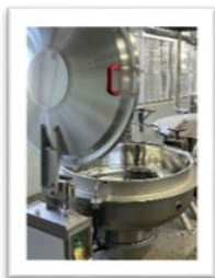
給食室の調理器具と板橋区でとれた野菜