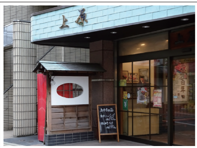
旧中山道の街道筋を意識したお店の外観

ここは格好の街道筋なもんですから、お店の軒先も、街道筋であることを意識して、和風の庇にしたり、自動販売