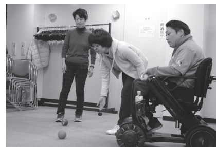
ボッチャを体験してみませんか