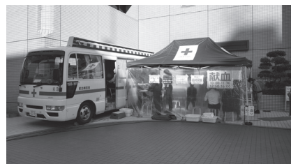
いのちのリレーをつなぎませんか

▽とき = 4月14日(火)、10時～11時30分・12時50分～16時▽ところ = 区役所(正面玄関横)▽問 = 東京都赤十字血液センター ☎5272-3523、板橋区総務課総務係 ☎3579-2052