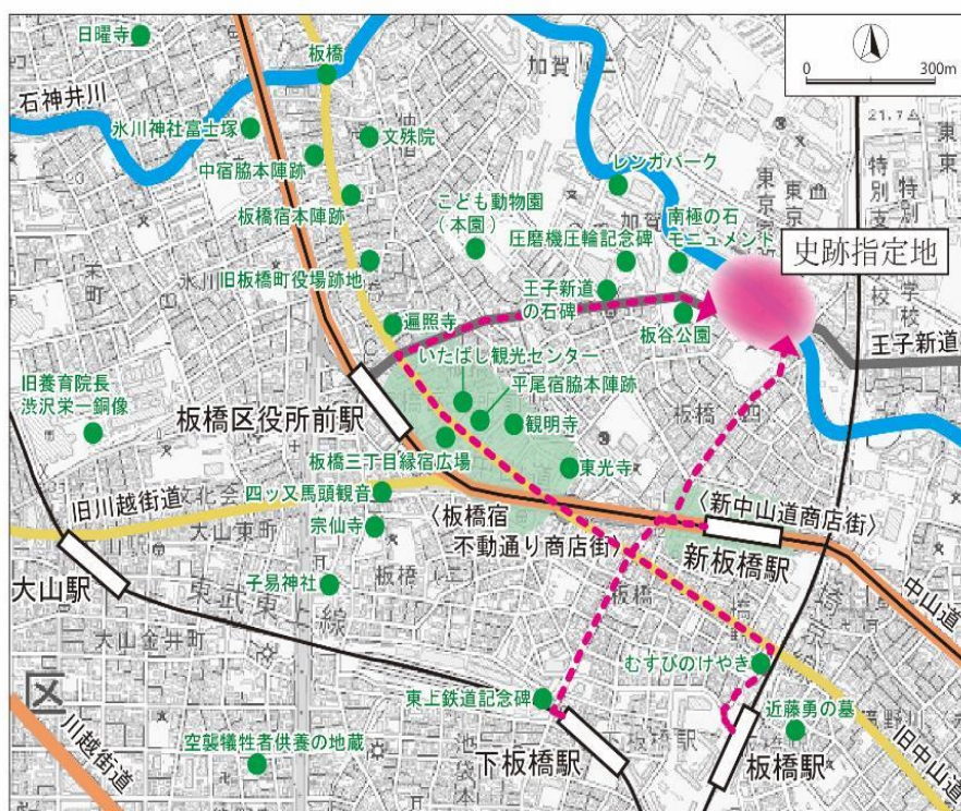
図 2：板橋駅・新板橋駅から史跡指定地までのルート図

本ルート例では、旧中山道から王子新道を通り、史跡指定地に至るルートと、旧中山道を右折し、中山道を横断、板橋五中横を通るルートを示している。