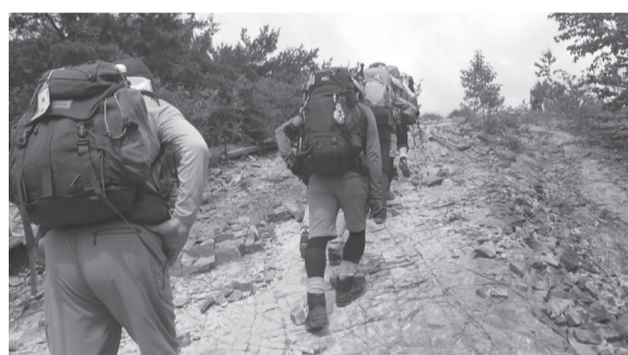
一緒に登山を楽しみませんか

▽とき = 9月12日(土)~14日(月)(2泊3日)※朝6時50分に区役所正面玄関前集合・14日(月)18時解散予定※往復貸切バス利用▽宿泊 = 青苔荘(長野県南佐久郡)など※男女別相部屋▽内容 = 東天狗岳・根石岳の登山※歩行時間は初日約4時間・2日目約7時間・3日目約5時間▽講師 = 登山家 大谷映芳▽対象 = 登山靴・雨具・ザックなどをお持ちで、2泊以上の登山経験があり、年数回の山歩きをしている方▽定員 = 27人(抽選)※申込者が14人以下の場合は中止▽費用 = 4万7900円※申込方法など詳しくは、植村冒険館ホームページをご覧ください。▽問 = 植村冒険館 ☎3969-7421〈月曜休館。ただし8月10日(祝)は開館し11日(火)休館)※本事業は、民間旅行会社への委託事業です。