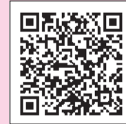
高島平温水プール