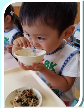
給食 温かくて美味しい 給食を食べるよ♪