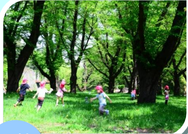
戸外活動 天気の良い日は外で 思い切り遊ぶよ♪