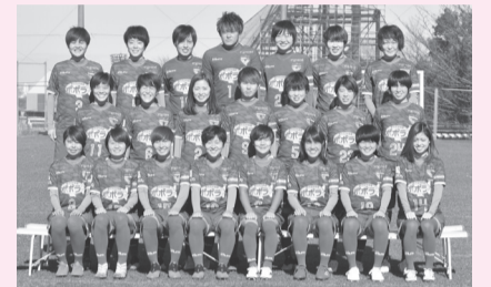
日テレ・東京ヴェルディバレー