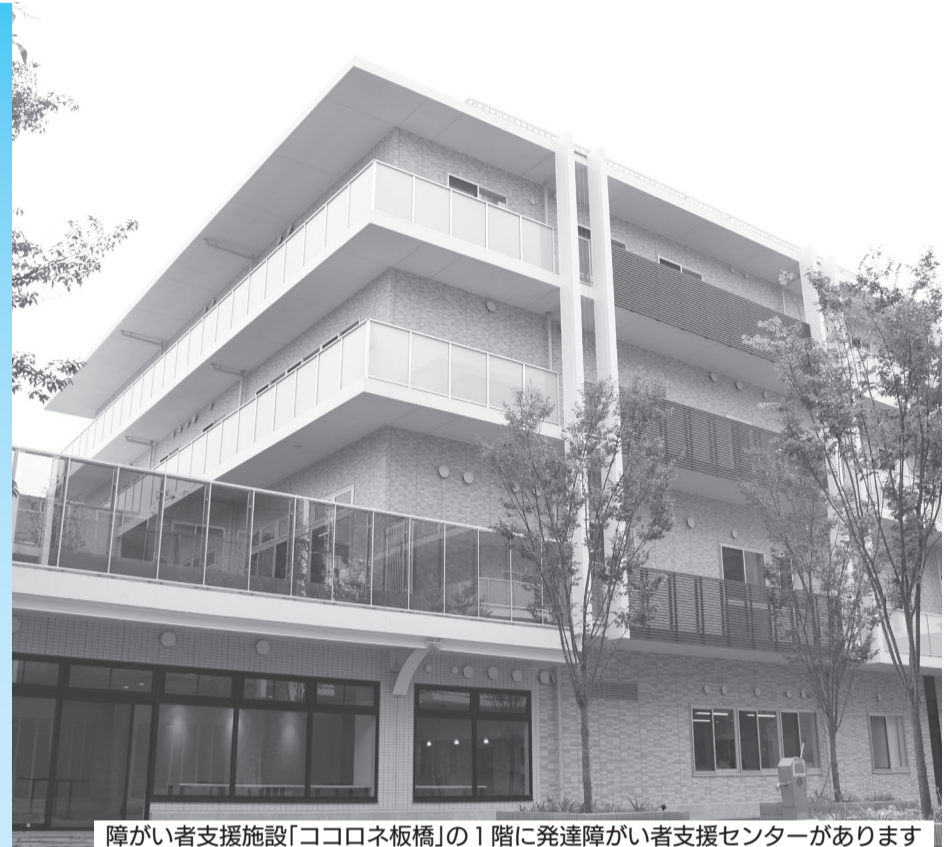
障がい者支援施設「ココロネ板橋」の1階に発達障がい者支援センターがあります

ところ・問合せ 発達障がい者支援センター(向原3-7-9 ココロネ板橋1階)☎5964-5422(月曜・日曜・祝日休み)