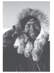
植村直己