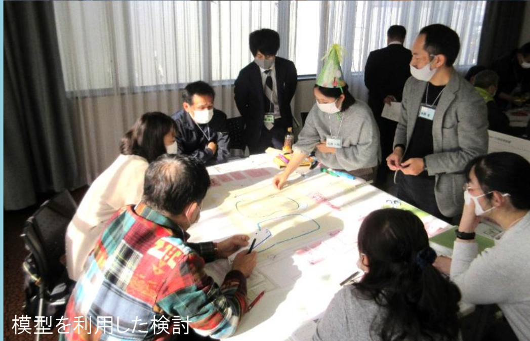
模型を利用した検討