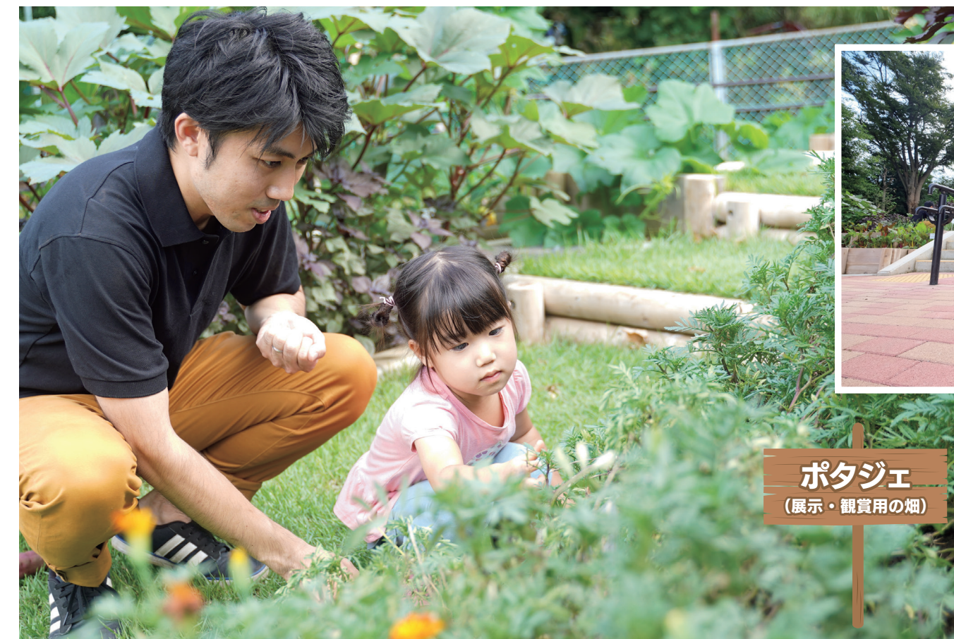
ポタジェ (展示・観賞用の畑)

ポタジェとは、フランスのデザイン性が高い家庭菜園のことです。四季折々の野菜の花・葉・色の組み合わせを楽しみながら、野菜について学ぶことができます。