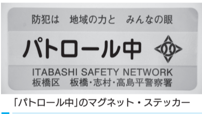
「パトロール中」のマグネット・ステッカー

業務中に使用する車・バイク・自転車などに「パトロール中」のマグネット・ステッカーを貼り、地域の見守り活動や不審者の通報などを行っています。現在、124事業者(従業員数約8000人・車両数3919台)が、業務の傍らパトロールを行っています。