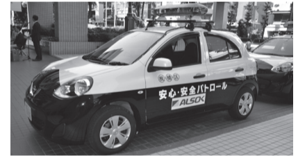
青色防犯パトロールカー

犯罪防止・児童の安全確保・資源持ち去り防止などを目的に、3台の青色防犯パトロールカーが警察署と連携して、24時間体制で区内全域を巡回しています。