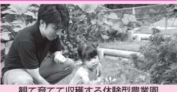
観て育てて収穫する体験型農業園

6月 ★都が東京アラートを発令し、警戒を呼びかけ ★国が新型コロナ接触確認アプリ(COCoA)の運用を開始