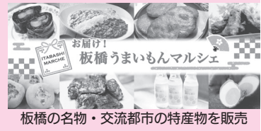
板橋の名物・交流都市の特産物を販売

11月 ★区内の新型コロナ感染者が1000人を超える ★都が新型コロナの警戒レベルを最高レベルに引き上げ