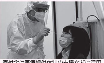
寄付金は医療提供体制の支援などに活用

7月 ★国がGo To キャンペーンを開始 ★国内の新型コロナによる死亡者が1000人を超える