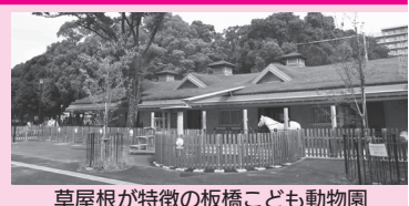
草屋根が特徴の板橋こども動物園