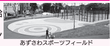
あずさわスポーツフィールド

8月 ★都が飲食店などに営業時間の短縮を要請 ★4月～6月期の実質GDP(国内総生産)が年率27.8%減