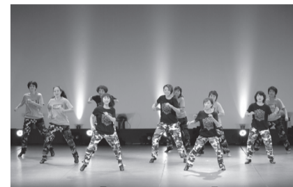
日頃の練習の成果を発表してみませんか

文化会館内) ☎3579-3130※申込記入例の項目と団体名、出演希望日(どちらでもよい場合は優先順位)、出演ジャンル(演奏・歌・ダンスなど)、出演人数を明記。※同財団ホームページからも申込可