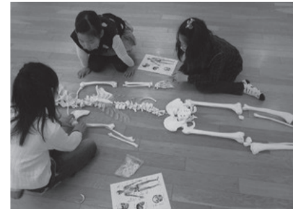
模型を復元しながら体の仕組みを考えてみよう

●飛ぶ種の模型を作ろう ▷とき = 3月29日(月)13時～14時▷対象 = 5歳以上の方(小学2年生以下は保護者同伴)▷費用 = 1500円(兄弟で参加の場合、1人増えるごとに500円増) ●がいこつ教室 ▷とき = 3月29日(月)15時～16時