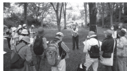
自然に親しんでみませんか

▷募集人数=20人(抽選)▷活動期間=4月から1年間※更新可▷内容=区内の野草・昆虫・野鳥などの調査、野外観察会(年3回程度)、地域でのグループ活動(定点観察・自由研究の発表)※4月18日(日)13時30分~16時に、エコポリスセンターで説明会あり。▷対象=中学生以上で、初めての方▷申込・問=3月27日(必着)まで、往復はがきで、同センター(〒174-0063前野町4-6-1) ☎5970-5001(第3月曜休館)※申込記入例(4面)の項目と説明会の出欠を明記※同センターホームページからも申込可