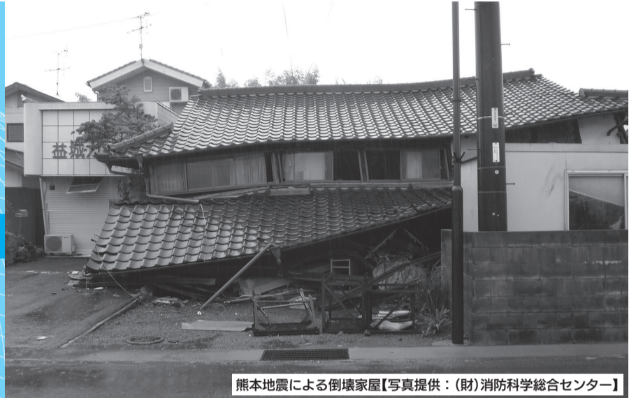
熊本地震による倒壊家屋