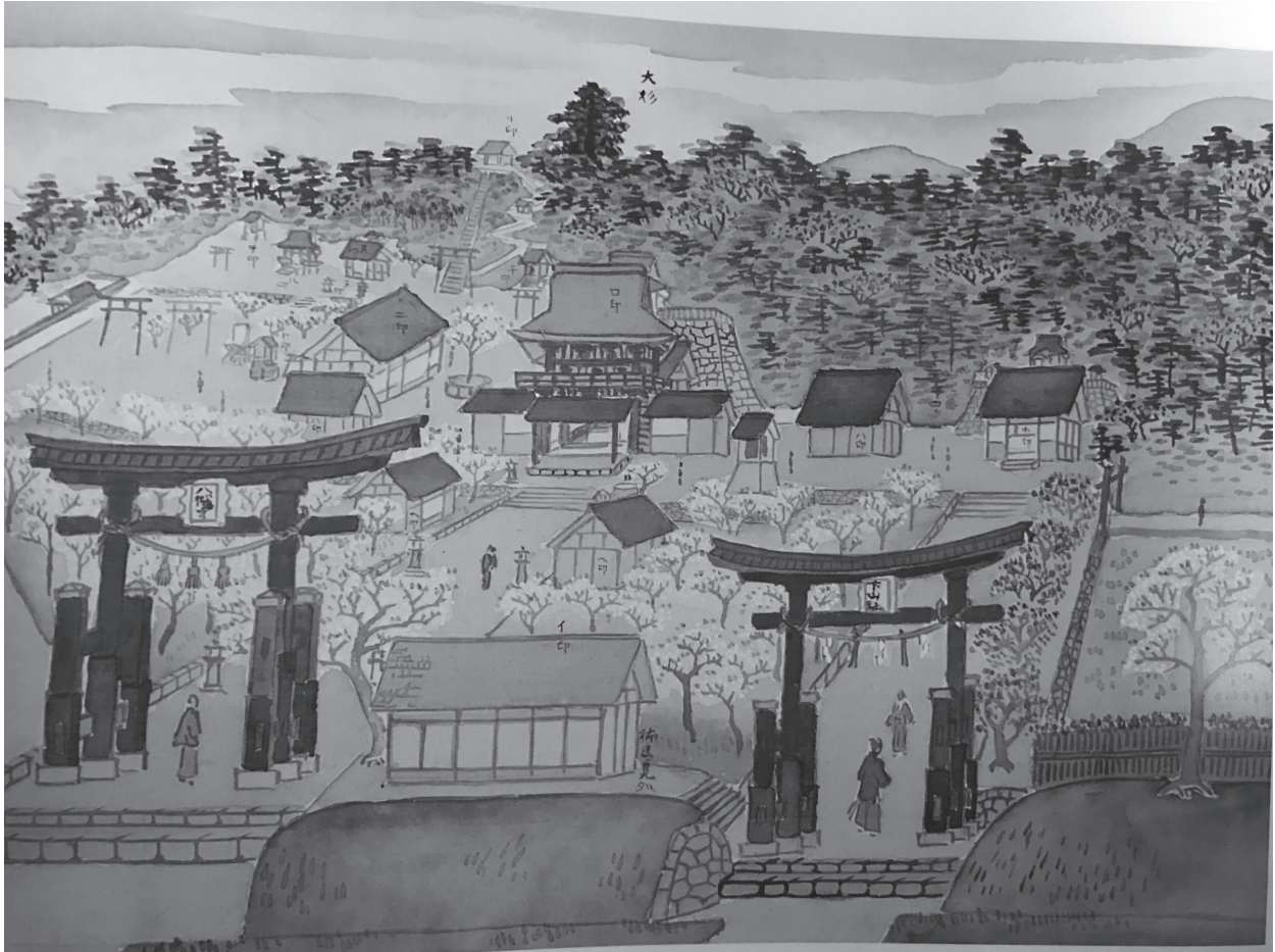
〈図1 「津和野百景図」の第三十五、鷺原八幡宮其の他〉

「津和野百景図」には「第三十五、鷺原八幡宮其の他」に鷺原八幡宮の境内の様子が描かれている。