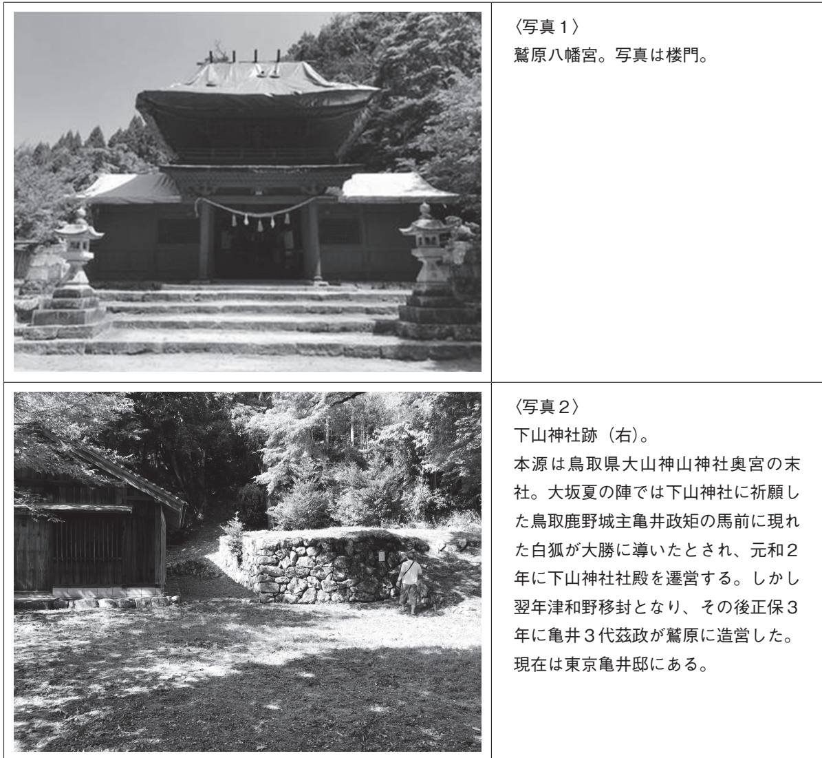
〈表2 現在の鷲原八幡宮の様子を示す写真と説明〉

現在では下山神社は跡地が残っているのみでそこに続いていた参道や鳥居も無くなっており、木々の生え方からそこに参道があったことが窺える程度である。摂末社は稲生神社、淡島神社、名称不明の小祠がある。以下の表2で、詳細を紹介する。