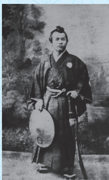
渋沢栄一