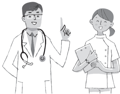
《医師によるもの忘れ相談》

▶ とき・ところなど = 下表参照 ▶ 対象 = 区内在住の65歳以上で、もの忘れが気になる方・その家族※もの忘れで医療機関にかかっていない方 ▶ 定員 = 各回1人(申込順) ▶ 申込・問 = 電話で、希望会場を担当するおとしより相談センター