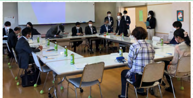
■第3回改築検討会では提言書(案)をまとめました。

令和4年5月10日の第3回改築検討会では、教育委員会が「地域提言書」を踏まえて作成した「基本構想・基本計画(案)」を報告しました。「地域提言書」が「基本構想・基本計画(案)」にどのように反映されているか、や内容の確認を行いました。