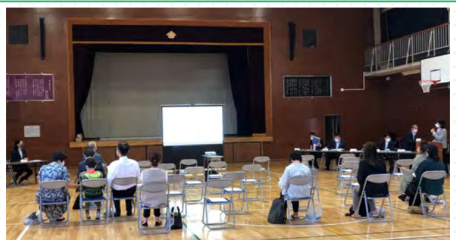
■基本構想・基本計画案の説明を行いました。

保護者や地域の方に向けた「基本構想・基本計画(案)」の説明を計4回にわたり行いました。