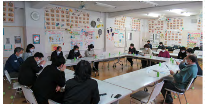
■第2回改築検討会では地域提言書(案)をまとめました。

令和4年3月22日の第2回改築検討会では、全3回のワークショップ※1での意見を集約し、地域と学校の関わり方や、建物の配置など改築に関わる様々な意見・アイデアについて「地域提言書」として内容をまとめました。