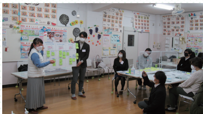
■各グループの意見交換後は発表を行いました。