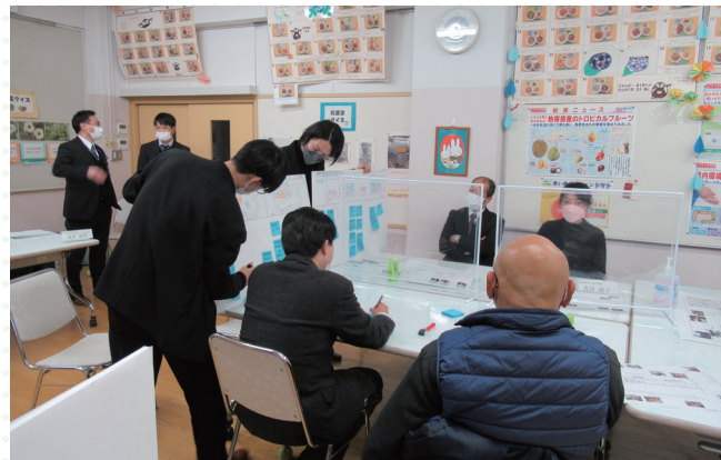
■地域開放、連携ゾーンについて意見交換を行いました。