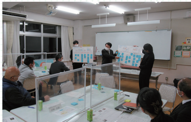
■各グループの意見交換後には発表を行いました。