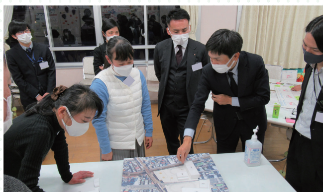
■模型を使って、様々な意見交換を行いました。