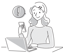
《マイナポータルによる電子申請サービス》