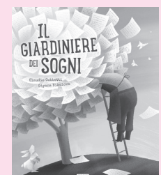
©2018 Sassi Editore Srl Viale Roma 122/b 36015 Schio (VI) - Italy Text©Claudio Gobbetti Illustrations and design©Diyana Nikolova