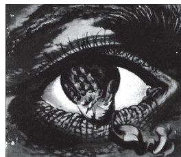
藤田鶴夫「悲劇の目(凝視)」

絵画には、目を描くことで当時の社会状況・画家の想いが反映されているもの、目の存在から絵を見る私たちに訴えかけてくるものなどがあります。