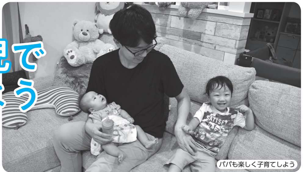
パパも楽しく子育てしよう

男性の家事・育児を支援するため、パネル展示・セミナーなどを行います。この機会に、職場・家庭での過ごし方を考えてみませんか。