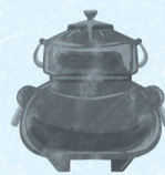
表1 かくしゃく講座