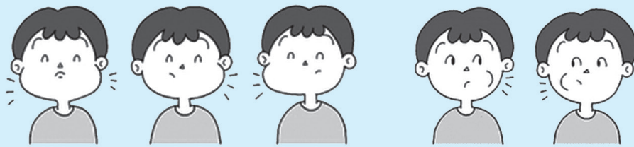
両頬をふくらませる 左頬をふくらませる 右頬をふくらませる 唇の裏側をなめるように舌を口の中で回す(左右)