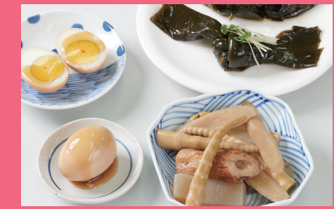
結び昆布・味付け玉子・うま煮