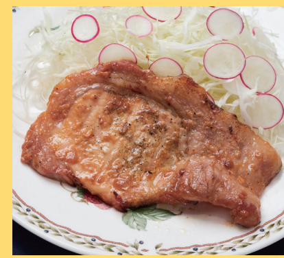
福島県白河市 白河高原清流豚の 紅白満喫セット 4617円