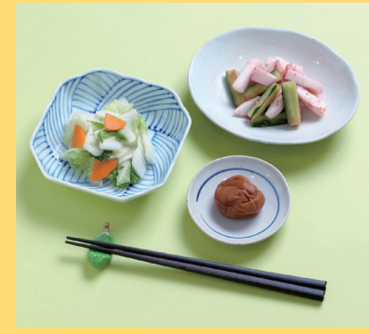
和歌山県みなべ町 紀州南高梅うまいもの 3点セット 1100円