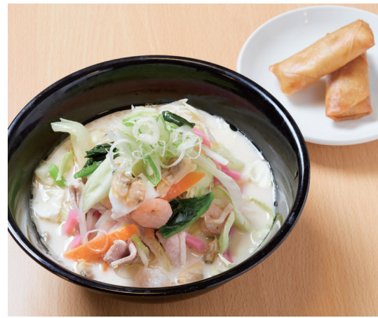
長崎ちゃんぽん春巻き付き

交流自治体のご当地メニュー(岩手県江刺市産りんごジュース付き)を楽しめます。 ▶とき=11月8日(月)~13日(土)、11時から ※各日とも売り切れ次第終了 ▶ところ=カフェダイニングNAKAJUKU(区役所1階)