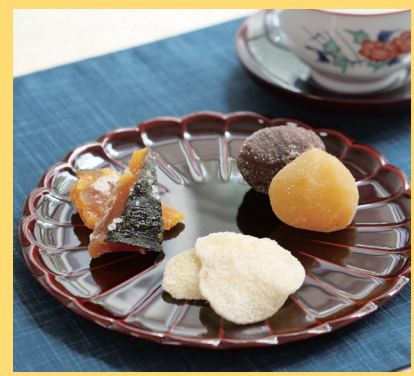
群馬県高崎市 栗甘納豆・かぼちゃ糖・ しょうが糖セット 3780円