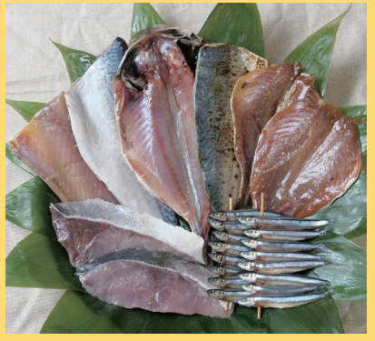
長崎県長崎市 「長崎俵物」 贅沢セット 5400円