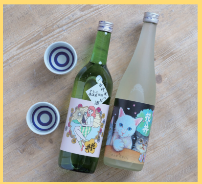
愛知県桜井市 古代米のお酒と はにゃのい純米酒セット 3630円

※税込価格(送料が別途必要になる場合あり) ※全33団体のいちおしセットを販売中