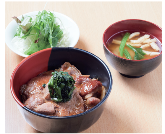
十勝豚丼サラダ付き