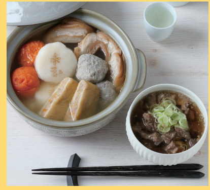
石川県金沢市 金澤おでんと 牛すじ煮込みセット 4400円