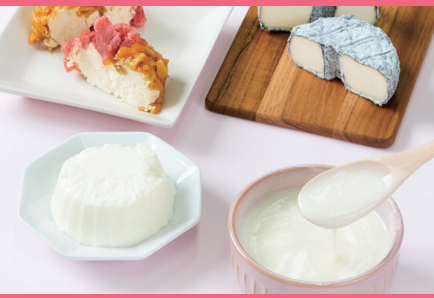
チーズ・ヨーグルト