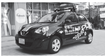
青色防犯パトロールカー