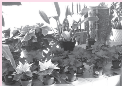
ミニポインセチア販売