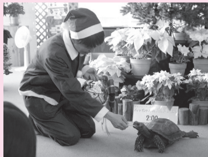
「ムッチャン」クリスマス点灯式