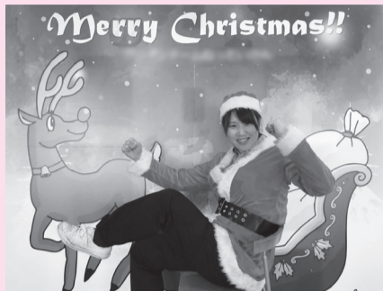
クリスマスフォトスポット