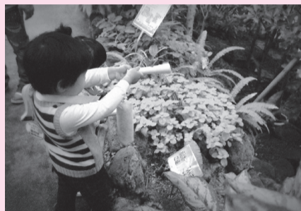
トワイライトジャングル探検