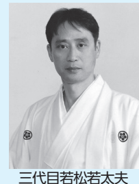
三代目若松若太夫

新型コロナウイルス感染症の影響で、記事の内容が中止・変更になる場合があります。詳しくは、区ホームページをご覧ください