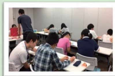
学び i プレイス