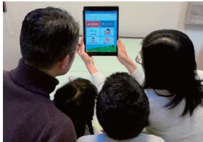
子育て支援情報アプリの利用イメージ

コロナ禍において、外出や対面での相談に不安を感じる妊婦や、体調不良などにより自宅安静や入院が必要で外出が困難な妊婦も妊婦面接を受ける機会を保障し、安心して出産・子育てに臨めるよう、来所による面接に加え、オンラインによる面接を導入します。