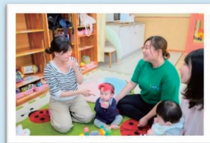
子育て応援児童館「CAP'S」