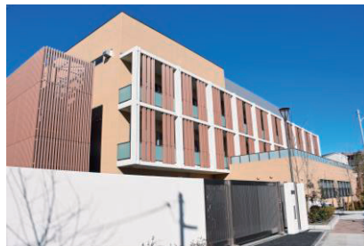
板橋区子ども家庭総合支援センター

不登校改善重点校を指定し、個々の不登校児童・生徒の状況に応じた必要な支援について、実効性のある取組を実践します。また、不登校対策特別委員会を開催し、学識経験者からの助言を基に取組を検討及び実践し、各学校に実践事例等を周知します。