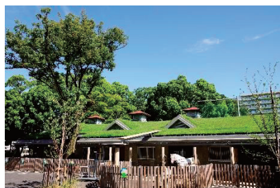
板橋こども動物園

若者の居場所としての i-youth において、さまざまな事業を通じた若者支援事業を実施します。事業実施にあたって、板橋区内外の大学、高校、NPO・ボランティア団体などの世代を超えた多様なネットワークを形成し、若者の活動を促進する仕組みをつくります。