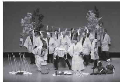
徳丸北野神社田遊び

申込=2月18日(消印有効)まで、往復はがき・電子申請(区ホームページ参照)で、生涯学習課文化財係※申込記入例(4面)参照