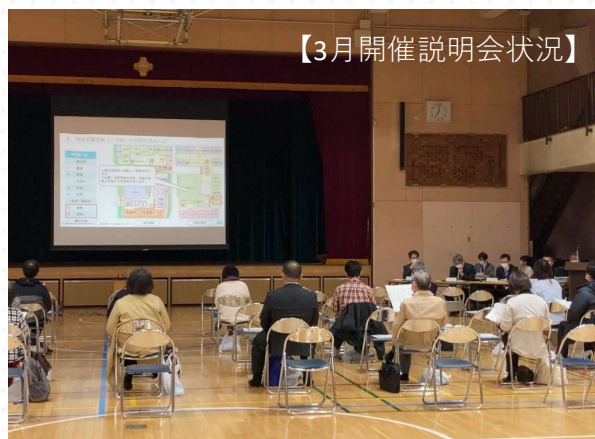
【3月開催説明会状況】