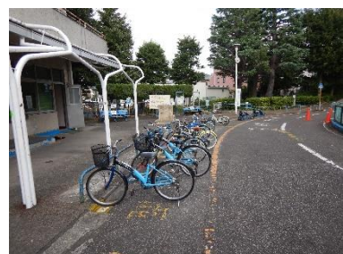
※写真は現状の板橋公園