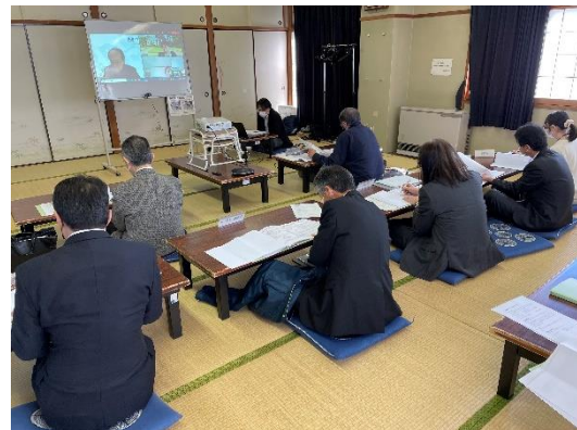
第2回板橋公園のあり方検討委員会