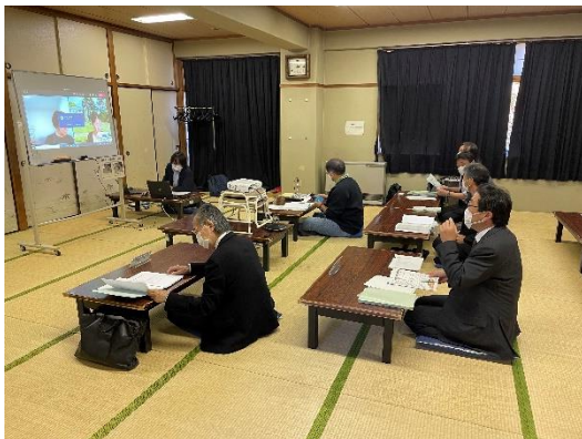
第1回板橋公園のあり方検討委員会