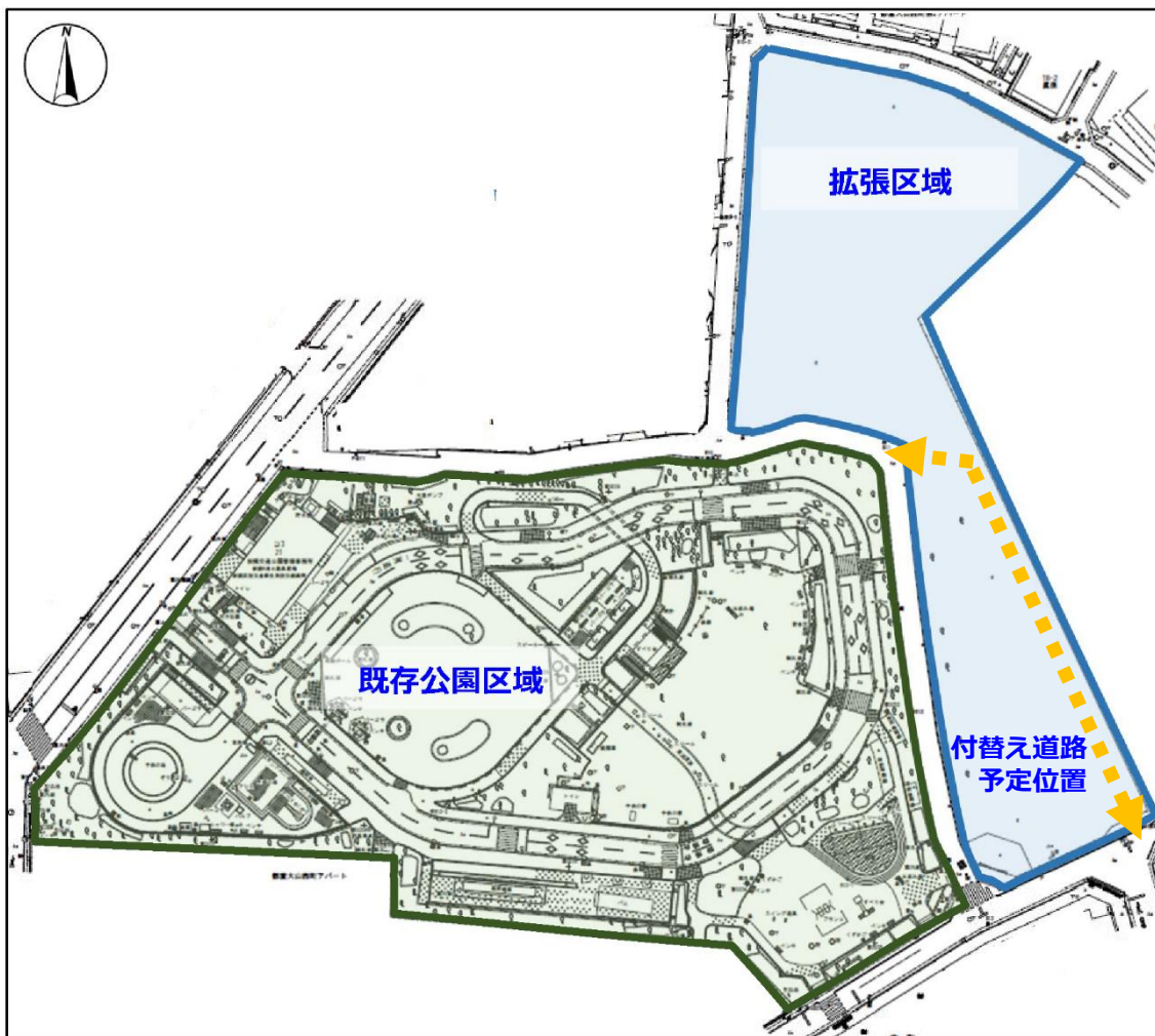
公園区域の拡張及び付替え道路予定図

隣接する旧大山小学校跡地を敷地に加え、板橋公園を拡張します。現況の道路の位置を見直し、付け替えることで、より使いやすい敷地形状とします。